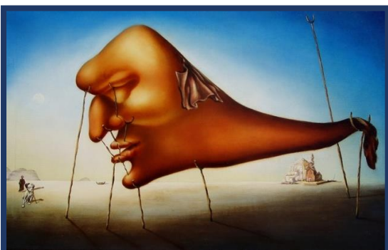
O SONO - 1937