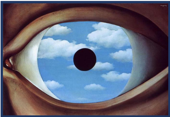
O ESPELHO FALSO - 1928