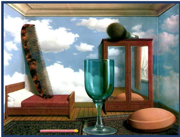
VALORES PESSOAIS - 1952