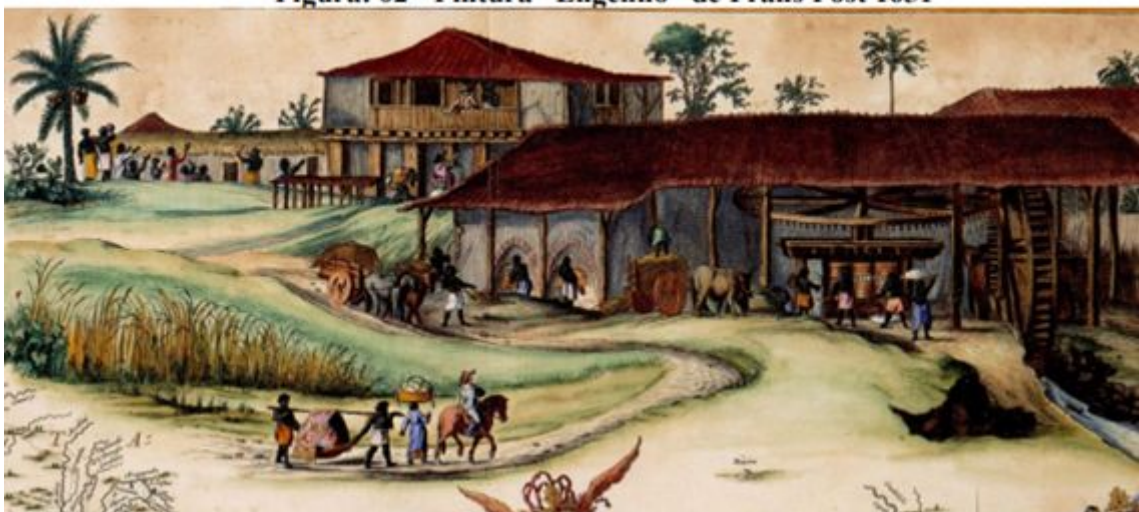
Figura: 02 - Pintura “Engenho” de Frans Post 1651

No final do século XVIII o Recôncavo abrigava três zonas agrícolas. Os colonizadores descobriram que os solos pesados da parte Norte do Recôncavo, também chamados de massapés, eram ideais para a cultura da cana-de-açúcar, principalmente em períodos chuvosos.